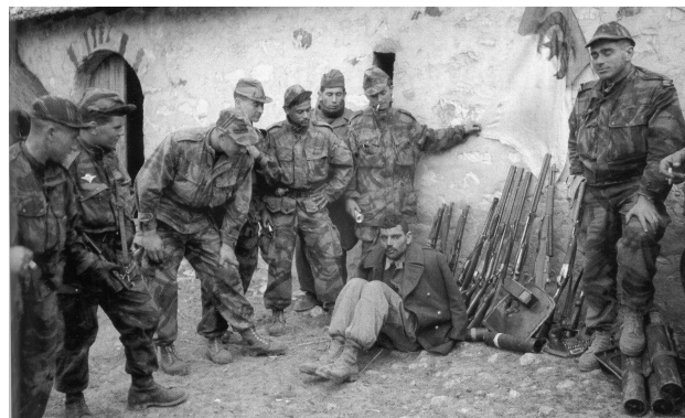
5 Un maquisard de l'ALN (armée du FLN) fait prisonnier Les parachutistes français exposent leurs prises : un prisonnier, des armes et le drapeau des indépendantistes algériens.

François Mitterrand, ministre de l'Intérieur, intervention devant l'Assemblée nationale, le 12 novembre 1954.