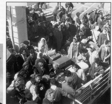
En 1962, un million de rapatriés et 60 000 harkis (auxiliaires algériens de l'armée française), choisissant entre « la valise ou le cercueil », fuient l'Algérie.

• Des Français rapatriés d'Algérie arrivent à Marseille